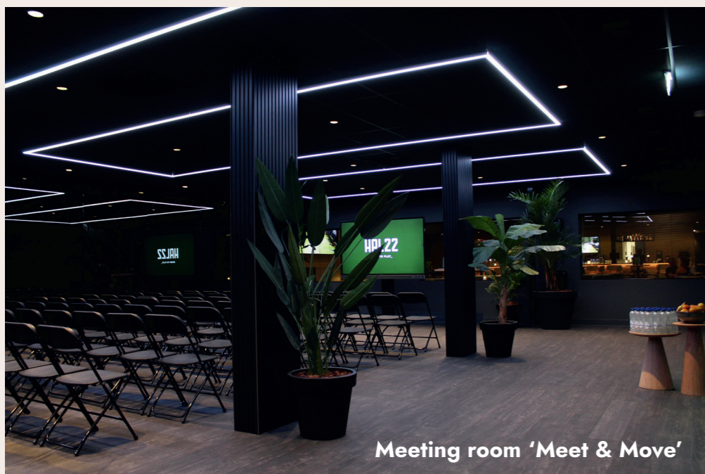
Meeting room 'Meet & Move'