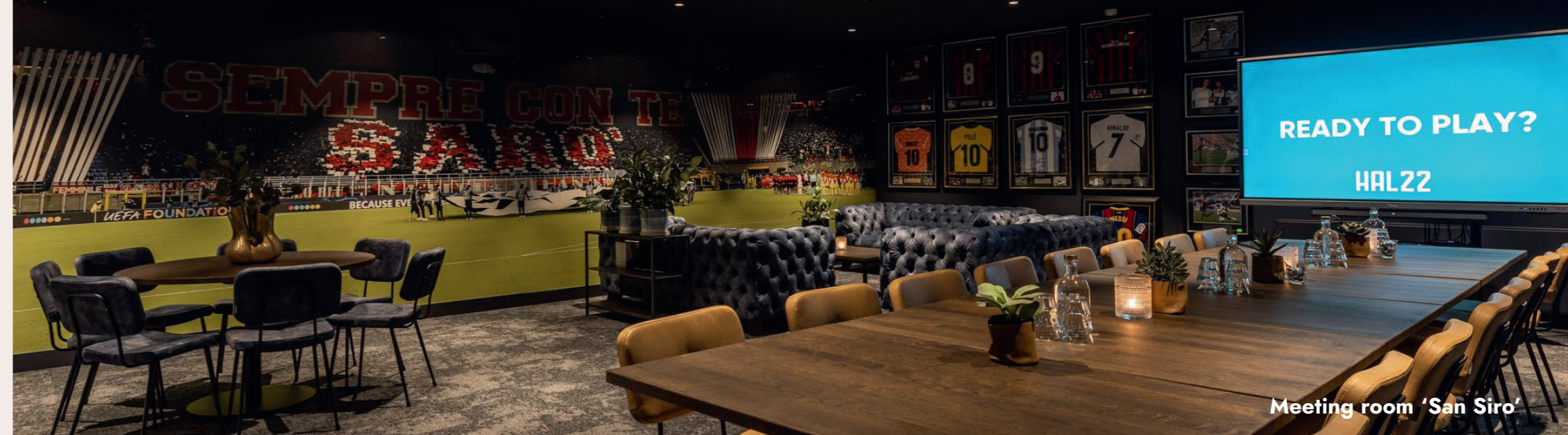
Meeting room 'San Siro'